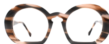
Meg Eyewear Clémentine